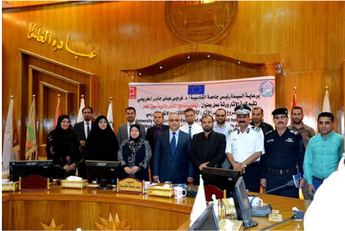
Local stakeholders and members of Qadisiyah of the WALADU project at the end of the workshop.