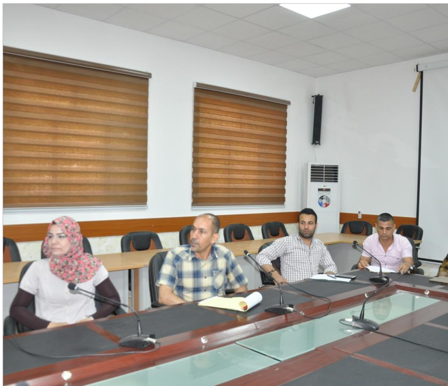
Public stakeholders and members of WALADU project attending the 2 nd Workshop.