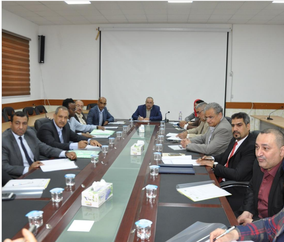
Public stakeholders and members of WALADU project attending the 1 st Workshop.